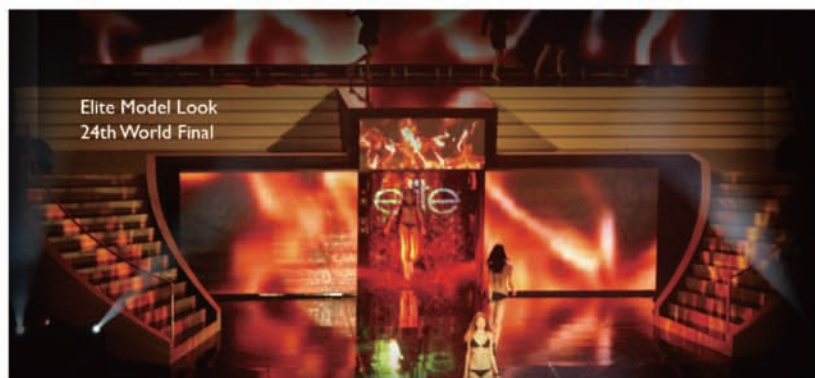
第24届世界精英模特大赛总决赛

FogScreen®投影屏能够将图像投射在半空中，是一款极富魅力的新型投影机。该产品具有极高的创新性，而且简单易用，适用于产品发布、展览、现场表演、夜总会、博物馆、主题公园和私人聚会等应用环境。