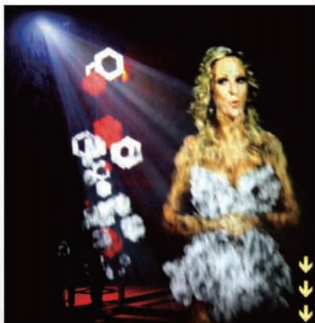
可口可乐Zero产品发布

FogScreen®投影机具备超高品质，而使用方法十分简单。该产品采用专利技术，使用普通自来水和超声波制造出平滑的水雾，并在水雾上投影图像。观众可以穿越FogScreen®的水雾投影屏，丝毫不会弄湿身体，因为微型水滴感觉是干燥的，与普通空气无异。